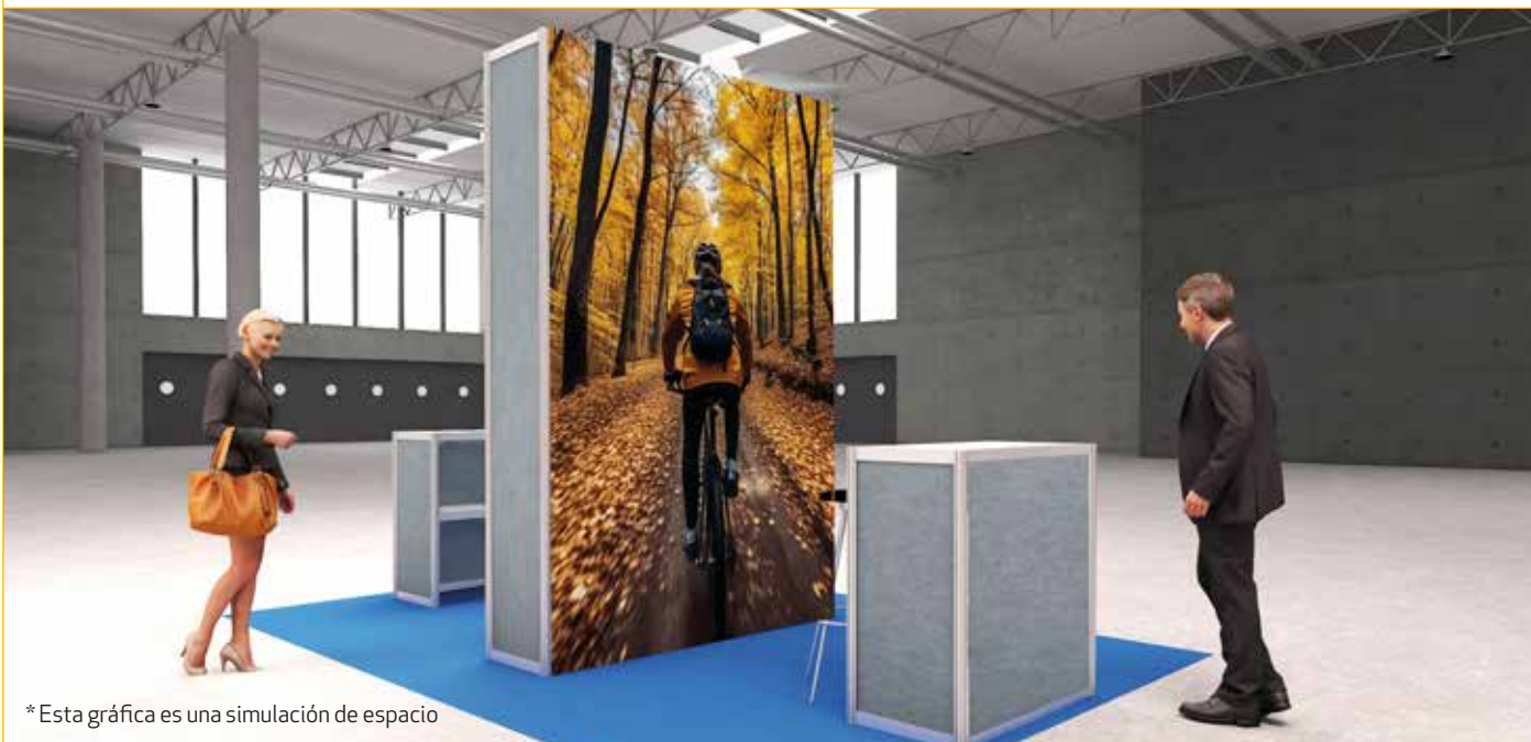
*Esta gráfica es una simulación de espacio