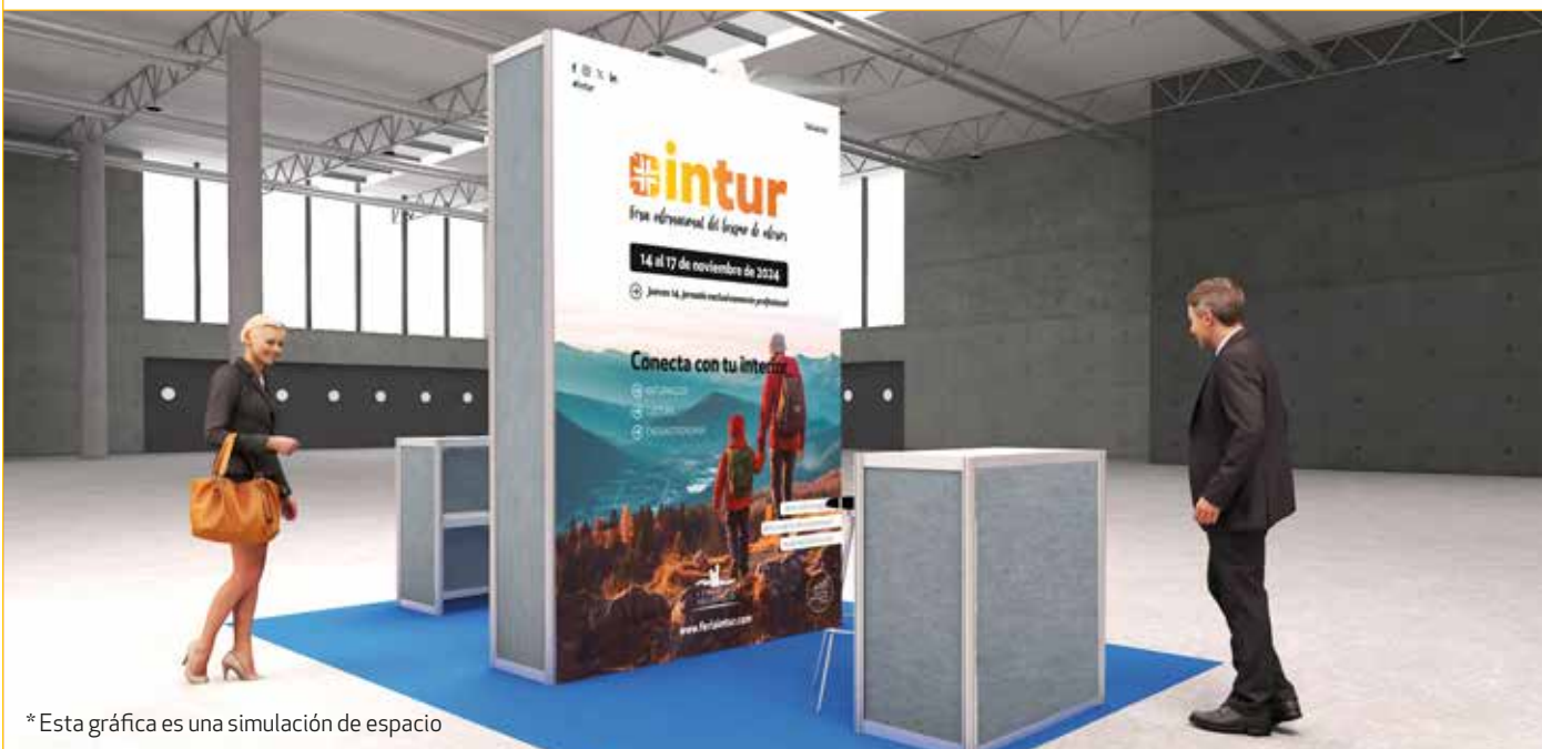
*Esta gráfica es una simulación de espacio